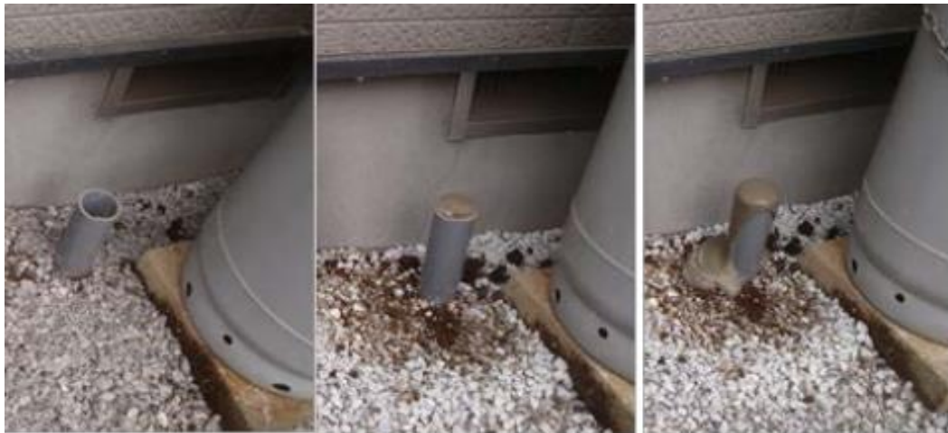
確認孔からの注入材吹き出し確認

建物周囲を埋戻し、注入ホースを空洞部に挿し入れ、ポンプにて圧力をかけながらセメントミルクを充填した。確認は、確認孔を数ヶ所作り、圧力で押し上げられてくるか確認した。