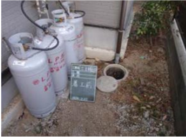
基礎下の空洞部確認