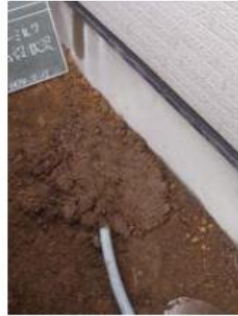
注入ホース埋込み