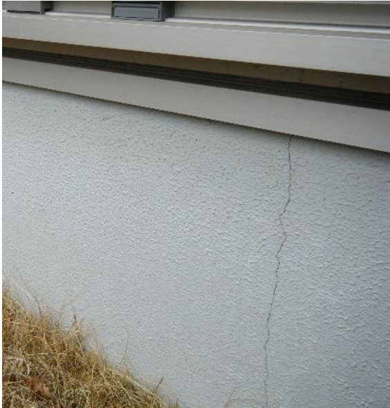
基礎クラック状況