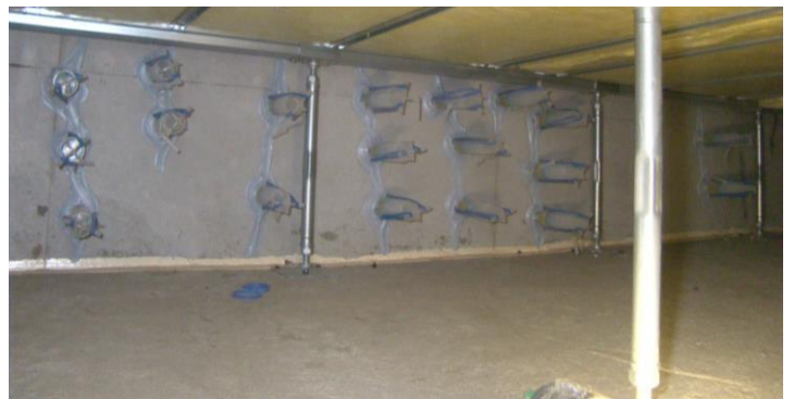
床下内部クラック注入状況