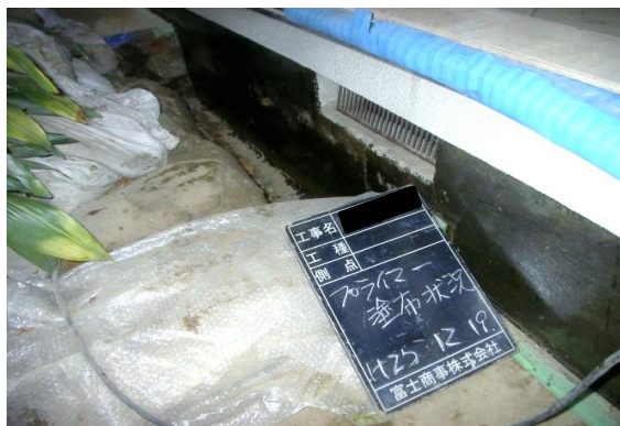
下地処理後プライマー塗布状況