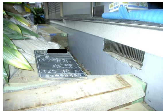
不陸補修材パテ塗布状況