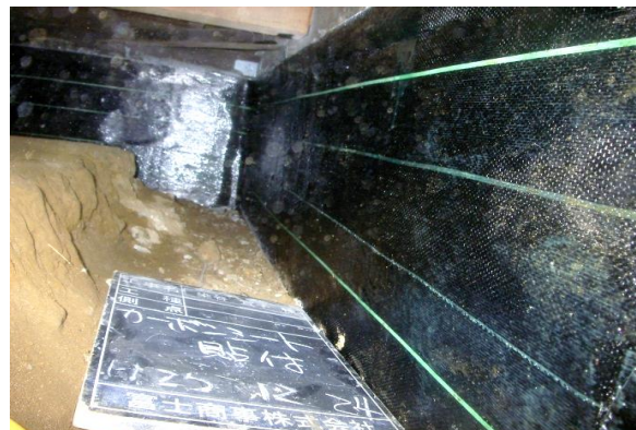
炭素繊維シート貼付状況(床下)